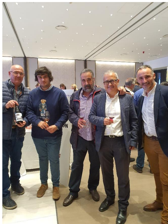
Miembros de la Asociación con representantes de Bodegas Mucy (D.O. Cigales)